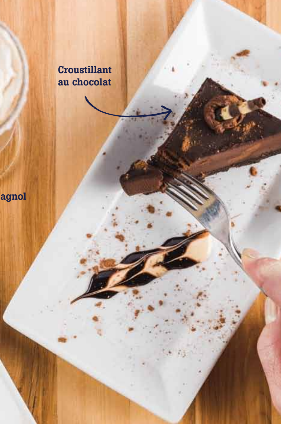
Croustillant au chocolat